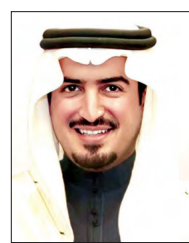
الشيخ خالد بن حمد

وحدة سكنية بالإضافة إلى أعمال البنية التحتية، بهدف توفير خيارات وحلول إسكانية مبتكرة تغطي سرعة توفير الوحدات السكنية للمواطنين. وأكد وكيل الإسكان أن الوزارة مستمرة في تطوير برنامج «مزاييا» والذي حقق نقلة نوعية في تلبية الطلبات الإسكانية من خلال فورية الخدمة والتي ساهمت في توفير السكن لأكثر من 9333 أسرة حتى أكتوبر في زيادة مطردة وواضحة تعكس حجم الفلحة بهذا البرنامج وتعاون القطاع الخاص الذي ساهم في رفد الاقتصاد الوطني بنحو 1.5 مليار دينار منذ إنطلاقه وحتى اليوم، وبدعم حكومي تجاوز 78 مليون دينار. وختم الشيخ خالد بن حمد تصريحه بالتأكيد على مواصلة المساعي والجهود لتحقيق رؤية البحرين الاقتصادية 2030 التي أطبقها صاحب السمو الملكي ولي العهد رئيس مجلس الوزراء في أكتوبر 2008، والتي تعد رؤية شاملة لتطوير المملكة، مع التركيز على هدف أساسي يتجسد في تحسين مستوى المواطنين وتحقيق الاستقرار، من خلال تنفيذ سلسلة من السياسات والبرامج الهادفة إلى تحقيق الكفاءة الإنتاجية والخدمات المتكاملة في المنظومة الحكومية تحقيقاً للتنمية الشاملة.