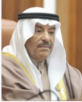
علي بن صالح الصالح

تنموية، وتطور مشهود. وأشار رئيس مجلس الشورى إلى أن سمو ولي العهد رئيس مجلس الوزراء بحر دول العالم بإدارته الحكمة للحملة الوطنية للتصدي لفيروس كورونا «كوفيد 19»، والإجراءات والخطوات التي تم اتخاذها للتصدي للجائحة، والتي جعلت البحرين في ريادة دول العالم والأكثر تميزاً في التقليل من تأثيرات الجائحة على جميع القطاعات. ونوه إلى أن البحرين مضت خلال الفترة الماضية في اتجاهين متوازيين، وبدعم ومساندة مباشرة من سمو ولي العهد رئيس مجلس الوزراء، حيث تصدّت لجائحة كورونا وفق تدابير وإجراءات متقدمة، وفي الوقت نفسه واصلت مسيرة تنفيذ الخطط والبرامج التنموية التي تعزز النهضة والتقدم في المجالات كافة.