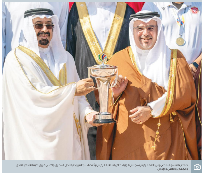
صاحب السمو الملكي ولي العهد (رئيس مجلس الوزراء) خلال استقباله رئيس وأعضاء مجلس إدارة نادي المحرق وولايي فريق كرة القدم بالنادي والجنابان الفنى والاداري.

مراقبته لفترة واتخاذ القرار بالتوجه لمقر سكنه بعد استصدار إذن من النيابة العامة. وقامت الشرطة بطرق الباب ففتح شخص كان بحالة غير طبيعية، وبسؤاله عن المتحري عنه قرر بأنه متواجد في الصالة، وعندما شاهد المتهم الشرطة قادمة باتجاهه وجه اليهم كلبين ضخمين من نوع بولدوغ كانا برفقتهم لهماجتمهم، وهو ما اضطر رجال الشرطة إلى النزول من السيارة عبر الدرج حرصاً على سلامتهم. ووقف رجال الشرطة خارج البناية وقاموا بتأمين المداخل والمخارج، بينما الكلبين متمرزين على بوابة البناية يدافعان عن صديقهما المتهم، واستغرق الأمر قرابة ساعة ونصف في محاولات مكثفة للسيطرة على الكلبين الشرسين، وبطريقة فنية تم إيلامهما، وعادت القوة إلى المتهم وقامت بالقبض عليه. وعثرت الشرطة على شوبو بالإضافة إلى