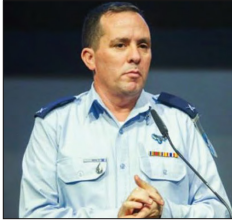
التحدث باسم الجيش الإسرائيلي ران كوخاف

العسكري أنه يوجد لدى إسرائيل خيار عسكري أيضا، وهي تعزز وتقوم بصيانة هذا الخيار. وأضاف: «واضح أن هذا الخيار موضوع على الطاولة». واعتبر بارليف أن الانسحاب الأمريكي من الاتفاق النووي مع إيران «جعل إيران أقرب من قدرة نووية». وفي إشارة إلى مفاوضات فيينا، قال بارليف: «ليس واضحا لنا كثيرا ما هي المواقف المختلفة لجميع أولئك الذين يفاوضونهم. وهل يمتنعون فعلا التراجع أمام الإيرانيين وإلغاء العقوبات والتوصل إلى اتفاق كهذا أو ذلك». وقد المسؤول العسكري على أن إسرائيل تريد لجم تقدم إيران نحو تخصيب يورانيوم بمستوى عال، وتريد العودة إلى الوضع السابق وتحسين الوضع وتمديد القيود على إيران». في سياق متصل أكد رئيس المخابرات البريطانية ريتشارد مور، أن إيران تستخدم ميليشيا حزب الله لتأجيج الاضطرابات في المنطقة. وأضاف أن طهران جعلت من حزب الله «دولة داخل دولة»، في إشارة إلى ممارسات الحزب في لبنان. كما، شُكف رئيس المخابرات البريطانية إن إيران والصين وروسيا تتصدر التهديدات التي تواجه بلاده حيث تتسابق كل من الدول والمظفرات غير المشروعة لاستغلال تكنولوجيا المعلومات سريعة التطور.