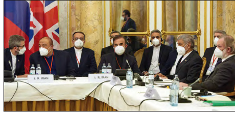
من محادثات فيينا 29 نوفمبر 2021

العسكري أنه يوجد لدى إسرائيل خيار عسكري أيضا، وهي تعزز وتقوم بصيانة هذا الخيار. وأضاف: «واضح أن هذا الخيار موضوع على الطاولة». واعتبر بارليف أن الانسحاب الأمريكي من الاتفاق النووي مع إيران «جعل إيران أقرب من قدرة نووية». وفي إشارة إلى مفاوضات فيينا، قال بارليف: «ليس واضحا لنا كثيرا ما هي المواقف المختلفة لجميع أولئك الذين يفاوضونهم. وهل يمتنعون فعلا التراجع أمام الإيرانيين وإلغاء العقوبات والتوصل إلى اتفاق كهذا أو ذلك». وقد المسؤول العسكري على أن إسرائيل تريد لجم تقدم إيران نحو تخصيب يورانيوم بمستوى عال، وتريد العودة إلى الوضع السابق وتحسين الوضع وتمديد القيود على إيران». في سياق متصل أكد رئيس المخابرات البريطانية ريتشارد مور، أن إيران تستخدم ميليشيا حزب الله لتأجيج الاضطرابات في المنطقة. وأضاف أن طهران جعلت من حزب الله «دولة داخل دولة»، في إشارة إلى ممارسات الحزب في لبنان. كما، شُكف رئيس المخابرات البريطانية إن إيران والصين وروسيا تتصدر التهديدات التي تواجه بلاده حيث تتسابق كل من الدول والمظفرات غير المشروعة لاستغلال تكنولوجيا المعلومات سريعة التطور.