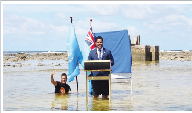
الوزير يلقي كلمته.

وظف رجل أعمال أمريكي يدعى ماثيس سيني «موظفة» من أجل صفحه في كل مرة يدخل فيها إلى فيسبوك، وأقدم سيني، من أجل التخلص من إدمانه على الشبكات الاجتماعية والتي يتزايد عندها يوما بعد يوم ويضع في تصفحها الأفراد وقتا هائلا. وانتشرت طريقة «سيني»، بين المتابعين بعد أن تفاعل إيلون ماسك أغنى رجل في العالم مع قصة الرجل على تويتر.