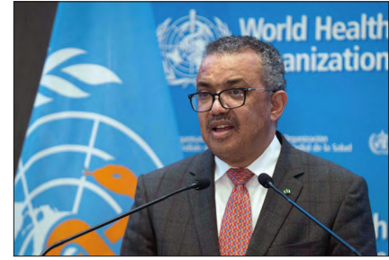
المدير العام لمنظمة الصحة العالمية