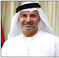
المختار نور بن محمد قرقاش

المختار نور بن محمد قرقاش، وزير الإعلام اللبناني جورج قرداحي، وتسيب في سحب الإمارات للدبلوماسيين والارابيين في بعضها والمواطنين الاماراتيين لدى لبنان. أكد قرقاش أن «الإمارات لن تمنع اللبنانيين من السفر إليها». ولتقت إلى أن «الإمارات ستواصل الدعم الإنساني للبنان، ولا تريد أن يواجه المواطنون اللبنانيون مزيداً من المعاناة بسبب الأزمة السياسية والاقتصادية المستمرة في بلادهم».