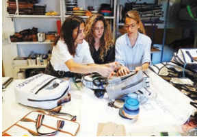
الشقيقات يعملن في صنع الحفلات.

تحدث الإعلامي المصري عمرو أديب عبر برنامجه «الحكاية، على قناة mbc» عن إجرائه حواراً تلفزيونياً مع الدولي المصري محمد صلاح نجم ليفربول الإنجليزي. ولم يعلن موعد عرض الحوار، فيما اكتفى أديب بالكشف على سيره في إحدى الحلقات المقبلة. عقب انتهاء الموسم، وشهدت الأشهر الماضية جولة طويلة من المفاوضات بين فريق البرنامج وإدارة قناة mbc مصر، من جانب عباس وكيل محمد صلاح وإدارة فريق تلفزيون من جانب آخر، وانتهت بالتوصل إلى اتفاق يقضي بظهور اللاعب خلال البرنامج مقابل الحصول على مبلغ مالي يعادل ١٠ ملايين جنيه مصري، ويعتبر هذا الأجر من أكبر الأجر الذي تقوّمه قناة mbc مصر، بمنحها لأحد الضيوف الذين تستضيفهم خلال برنامجه، ويرجع هذا الأجر الكبير إلى المكانة الكبيرة للشخص محمد صلاح عند جميع العرب في جميع أنحاء العالم.