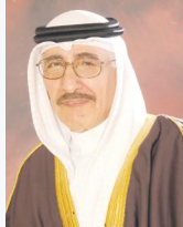
خالد محمد كانو

أساسياً في الاقتصاد الوطني، وتقديم مزيد من الدعم للمؤسسات القطاع الأهلي، والاحتفاء بقدرات وابتكارات الجيل الشاب ومنحهم المزيد من الفرص واستثمار طاقاتهم في تنمية القطاع الاقتصادي، بما يصب في مصلحة الوطن وتحسين مستوى معيشة المواطن. وقال كانو «حرصت الحكومة على إطلاق المبادرات وتطوير الخدمات الحكومية لمواكبة كافة التحولات والمتغيرات التي يواجهها سوق العمل العالمي والإقليمي، وبجهود فريق البحرين استطاعت المملكة أن تخطو في فترة وجيزة خطوات متقدمة نحو تعزيز مكانتها ودورها التجاري والاستثماري في المنطقة»، مؤكداً ثقته بخطة التعافي الاقتصادي التي ستقود الاقتصاد الوطني إلى مرحلة جديدة من الإنجاز.