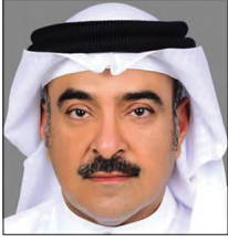
الشيخ هشام بن عبدالعزيز