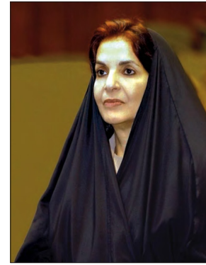
الأميرة سبيكة بنت إبراهيم